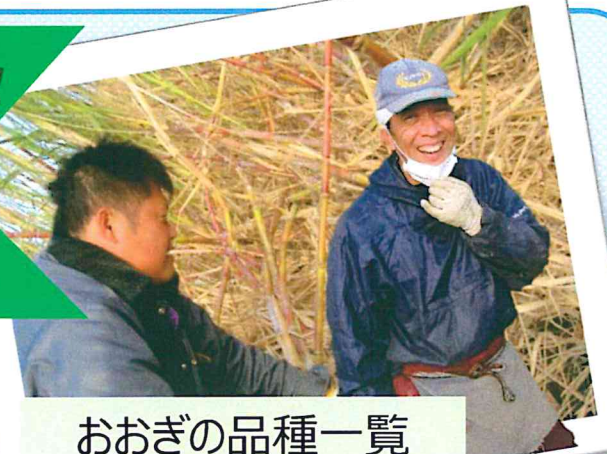
おおぎの品種一覧